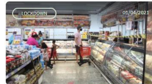
Supermercados de Santos poderão abrir até 22h nesta sexta