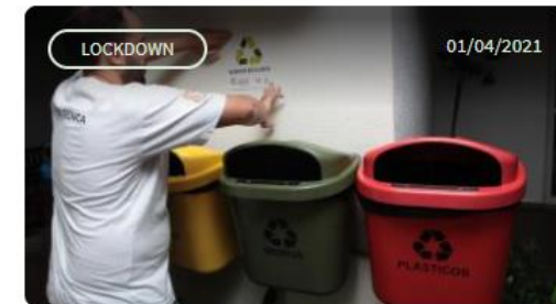
Limpeza de condomínios é liberada em Santos para combater o Aedes