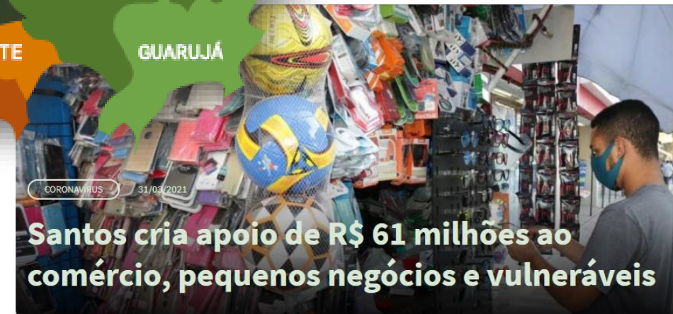
Santos cria apoio de R$ 61 milhões ao comércio, pequenos negócios e vulneráveis