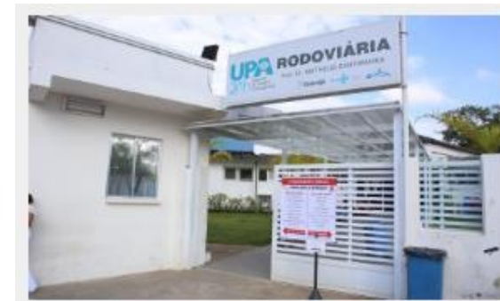
COVID-19 / 2 dias atrás UPA da Rodoviária passará a ser referência para atendimento a pacientes covid