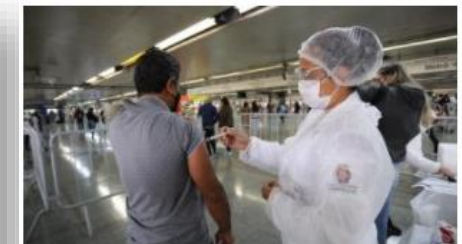
Vacinação contra Covid-19 nas estações do Metrô, CPTM e EMTU